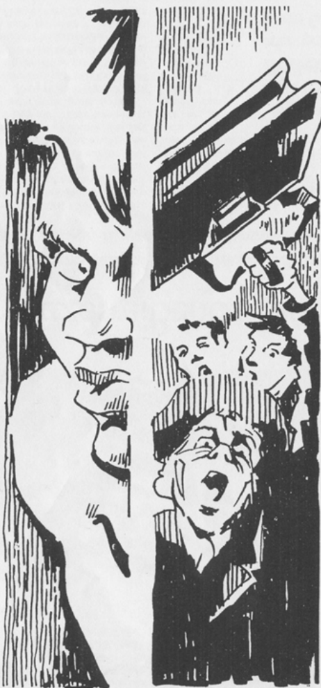
Die geeignete Illustration von Philip Ridleys „Disney Killer“ hat Georg Greiwe gefunden: In seinen düsteren Comic-Strips spiegelt sich die abseitig-isolierte Welt, in der die Geschwister Presley und Haley vegetieren. Comic-Strips.: Georg Greiwe

Nächste Aufführungen 10., 14., 19., 28.1., Brauhauskeller, 20.30 Uhr